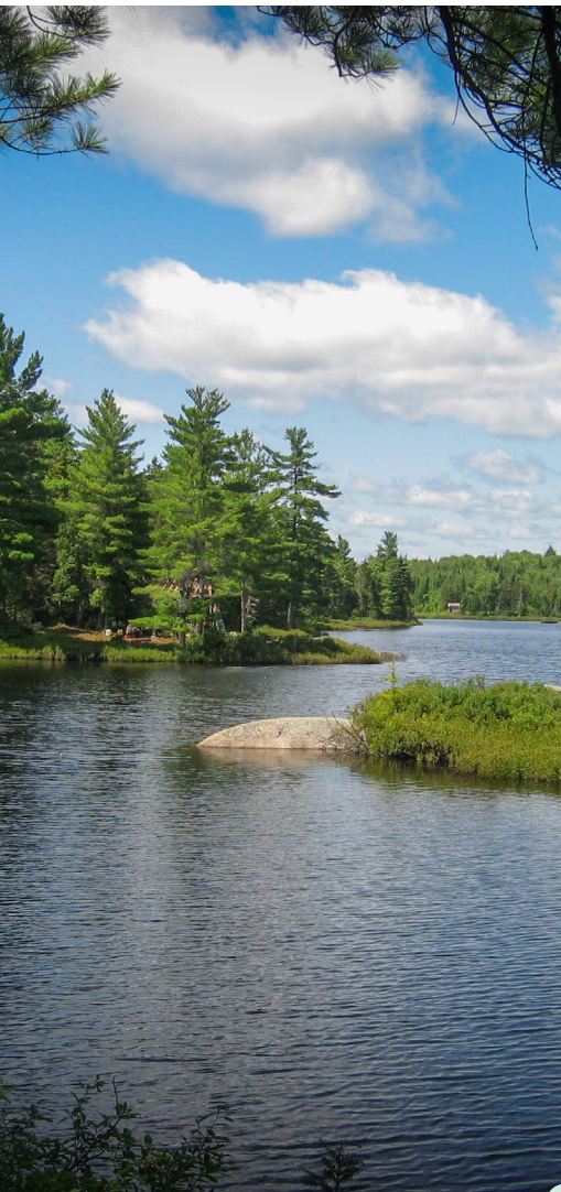
Lac de l'Aqueduc